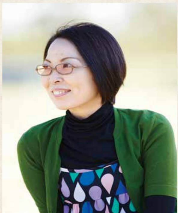
シンガーソングライター 佐田 玲子

存在感のある声と、天性の相対音感・リズム感に支えられたボーカルには定評がある。「肉声に近い、女歌を唄いたい」と彼女は語り、常に、心に響く歌を目指している。生楽器を大切にし、それらの楽曲は、今の時代に暖かく、優しい。TV・ラジオ等のパーソナリティーとしても活躍している。