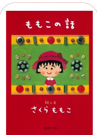
『ももこの話』 さくらももこ 著 集英社文庫 2006年

国民的な作品『ちびまる子ちゃん』の作者さくらももこ先生のエッセイです。先生の小学3年生時代を元に描かれた『ちびまる子ちゃん』ですが、エッセイはよりリアルな体験が書かれていて楽しめます。まるちゃんのおじいちゃん友蔵と、現実のおじいちゃんとのギャップに結構ショックを受けたりもしましたが、それもエッセイならではの発見です。何気ない日常がゆったりと語られていて、自分が体験したことじゃないけれど、しみじみと懐かしい感覚になりました。先生が子ども時代からすでに達観していると感じるエピソードが満載で笑ってしまいます。怒り爆発のお母さんに対し「きて、どうしたらいいんでしょう？」と逆に尋ねる場面では、思わず吹きだしました。まだ小学生にして、なんとというメンタルの強さでしょうか。