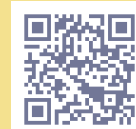
せんだい電子図書館