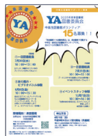
泉図書館 YA 図書委員会