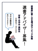
広瀬図書館 選書アドバイザー