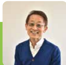
とよたかずひこ氏

宮城県仙台市生まれ。絵本に『どんどこももんちゃん』(第7回日本絵本賞)などの「ももんちゃんあそぼう」シリーズ、「おいしいともだち」シリーズ、「たのしいいちにち」シリーズ(以上童心社)、『でんしゃにのって』(厚生省中央児童福祉審議会特別推薦)などの「うららちゃんののりものえほん」シリーズ、「ワニのバルボン」シリーズ(以上アリス館)、「ぼかぼかおふろ」シリーズ(ひさかたチャイルド)など多数ある。紙芝居も多く、『ぞうさんきかんしゃぼっぽぼっぽ』(第56回高橋五山賞)、『でんしゃがくるよ』(以上童心社)などがある。